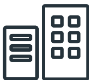
企業ホームページ